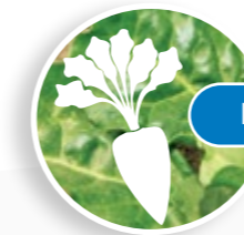
Plan đubrenja šećerne repe

FERTIACTYL® Starter - primena u fazi bokorenja u količini od 4-5 l/ha FERTILEADER® Axis - primena u fazi bokorenja i početka vlatanja u količini od 4-5 l/ha FERTILEADER® Vital - primena u fazi od pojave lista zastavičara do završetka cvetanja u količini od 4-5 l/ha