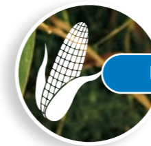
Plan đubrenja kukuruza

FERTIACTYL KOMPLEKS (European patent No. 945000107) pozitivno utiče na razvoj korenovog sistema i povećava kapacitet usvajanja hraniva od strane korena. Povećava pristupačnost hraniva u đubrivu i zemljištu kao i brzinu apsorpcije i translokacije hraniva u biljci. U stresnim uslovima, koji se često javljaju u početnim fazama rasta i razvoja biljaka, povećava njihovu otpornost na vazдушnu i zemljišnu sušu, visoke ili niske temperature i stimuliše proces fotosinteze koji se neometano odvija.