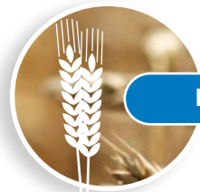
Plan đubrenja pšenice

FERTIACTYL® Starter - primena u fazi od 2-4 para listova u količini od 4-5 l/ha FERTILEADER® Gold - primena u fazi butonizacije u količini od 4-5 l/ha